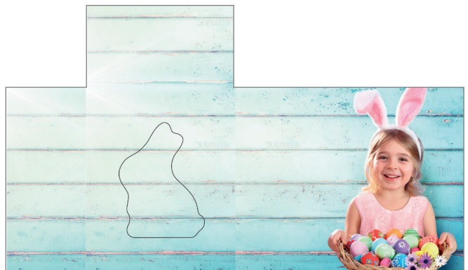
Art-Nr.: 213628 – Sweet Easter