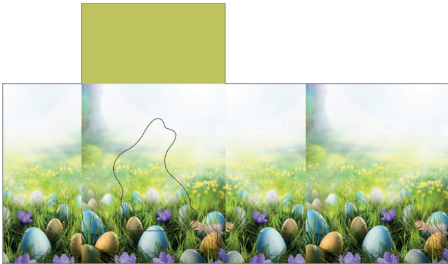
Art-Nr.: 213623 – Ostergarten

2. Dein Logo, dein Text oder dein Bild wie gewünscht platzieren, evtl. das Motiv farblich verändern. Fertig!