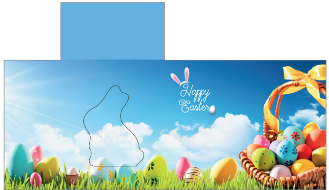
Art-Nr.: 213624 – Sunny Easter