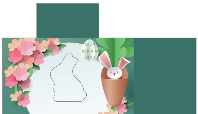
Art-Nr.: 213630 – Blumige Ostern