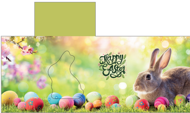
Art-Nr.: 213625 – Frühlingsgefühle