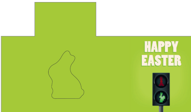
Art-Nr.: 213627 – Hasen Ampel