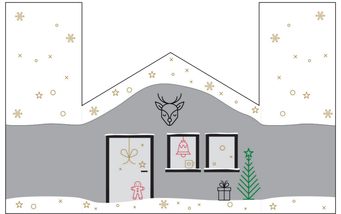
211076 – Weihnachtshaus, Grau