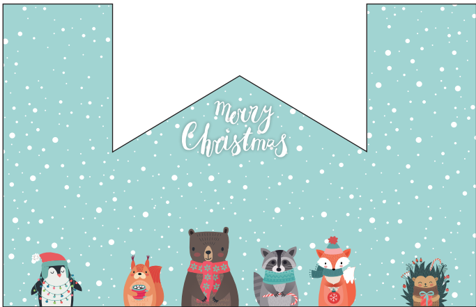
211197 – Weihnachtstiere