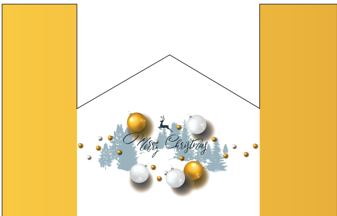
211201 – Winterlandschaft mit Weihnachtskugeln