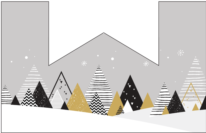
211070 – Weihnachtswald